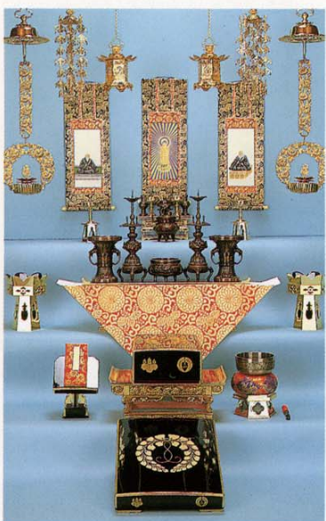
浄土真宗(本願寺派)

※お仏壇の大・小およびご宗派により、それぞれにお祀りの仕方が異なります。詳しくはお寺様又は当店におたずねください。